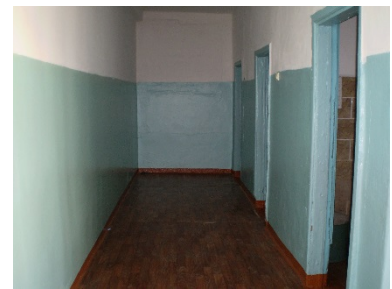
Фото. Помещения КППК до ремонта