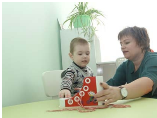
Фото. Занятие в КППК г. Темиртау

Принимая во внимание, что в самом городе Темиртау нет Кабинета психолого-педагогической коррекции областной акимат в лице Управления образования обратился с предложением об открытии Кабинета коррекции в г. Темиртау, который в дальнейшем будет служить основой для развития инклюзивной системы образования. Фонд «Дара» в 2017 году получил запрос от Управления образования Карагандинской области на оказание поддержки в открытии Кабинета коррекции в городе Темиртау.