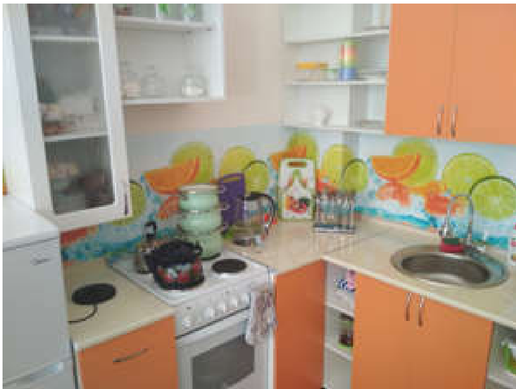
В кабинете социально-бытовой