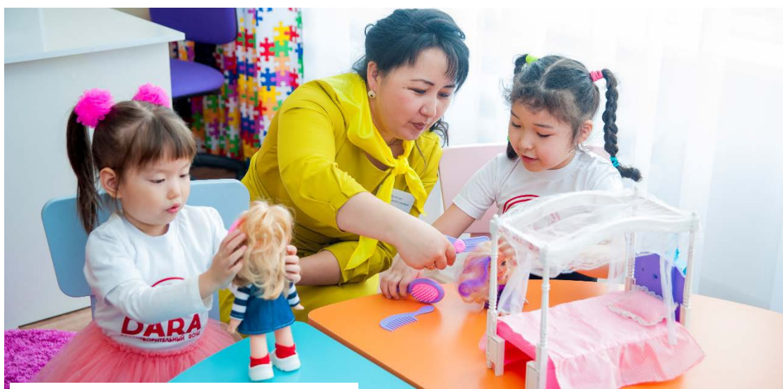
Фото. Занятия в КППК г. Темиртау