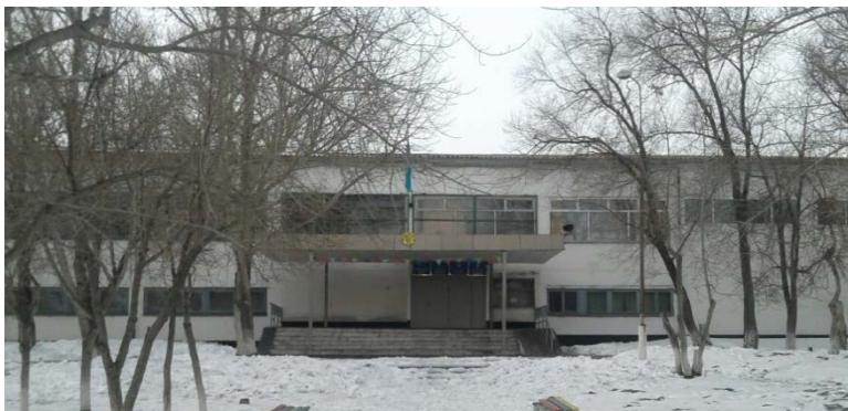
Фото. Здание школы №6

Одним из принципиально важных решений по проекту явилось размещение Кабинета на базе общеобразовательной школы. Это способствует более эффективному внедрению принципов инклюзии в общеобразовательную систему обучения, что позволит в будущем решить проблему социализации детей. Дети с особыми потребностями посещающие Кабинет коррекции, ранее не были охваченными никакими услугами образования, а теперь при поддержке специалистов получили доступ к услугам коррекции, а в дальнейшем смогут более активно переходить на совместное/инклюзивное обучение.