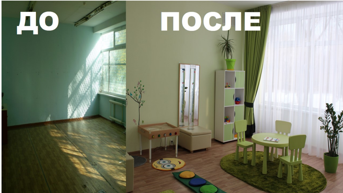
Фото ДО и ПОСЛЕ ремонтно-строительных работ