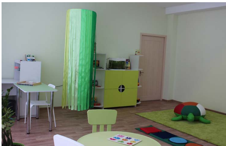
Фото. Кабинет психолога и сенсорная зона

Роль каждого специалиста важна, так например тифлопедагог помогает детям с нарушениями зрения, обучает шрифту Брайля а также даёт советы по адаптации к полноценной жизни. Ввиду разнообразия и сложности диагнозов, с ребёнком одновременно работают несколько специалистов, помогая ему социализироваться и учиться.