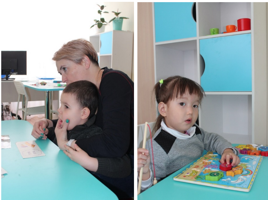
Фото. Занятие с логопедом в КППК г. Темиртау

Кабинет логопеда оснащён персональным компьютером с логопедическим тренажёром «Дельфа», способствующим коррекции речевых нарушений, наборы постановочных и массажных зондов, а также большим количеством дидактического материала и авторских методик коррекции.