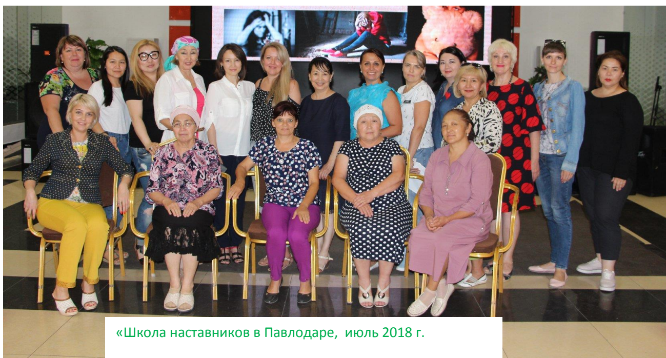
«Школа наставников в Павлодаре, июль 2018 г.

Если вы хотите принять участие в проекте Наставники, записывайтесь на инфовстречу и заполняйте анкету на сайте nastavniki.kz или отправляйте заявку на эл. почту или в Директ!