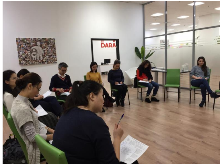
«Школа наставников в Астане, 17-18 ноября 2018 г.