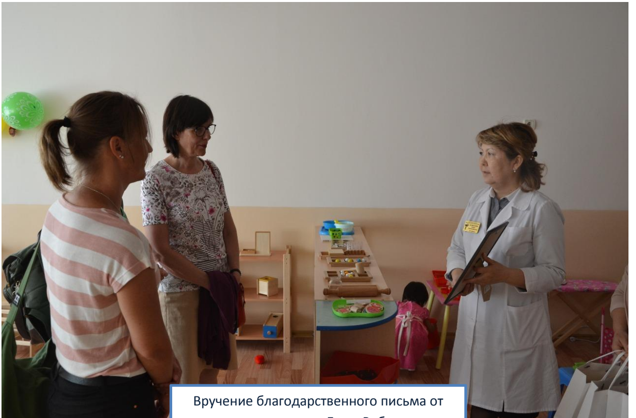
Вручение благодарственного письма от администрации Дома Ребенка