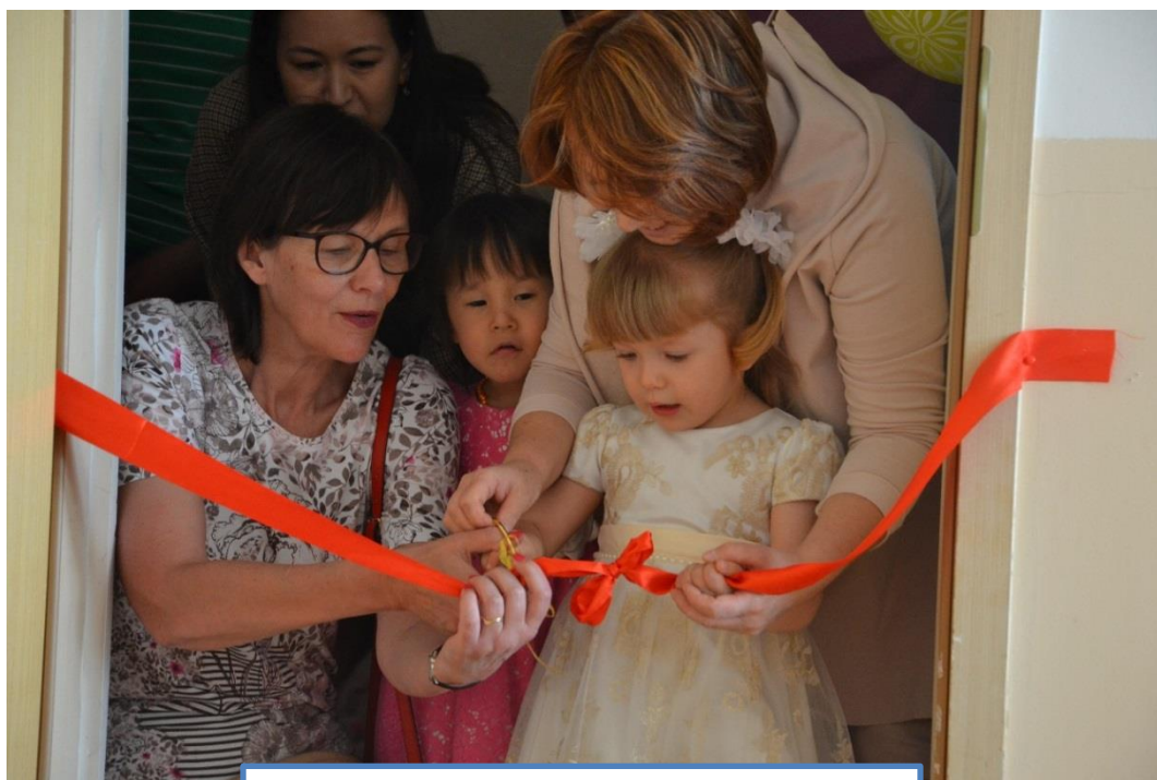
Официальное открытие комнаты Монтессори в Доме Ребенка г.Астана

Фонд имеет большой опыт в оснащении помещений комнат по системе М. Монтессори в разных государственных учебных заведениях и на сегодняшний день оснастили 26 учреждений по всему Казахстану, включая Дом Ребенка в Астане. Это стало возможным только благодаря поддержке и помощи Благотворительного комитета Дипломатического Клуба Супруг послов в Астане "ASA" Администрация Дома Ребенка выделило помещение с площадью 50 кв.м., и в рамках проекта он был оснащен 118 элементами по системе М.Монтессори. В штате учреждения предусмотрен один специалист, который ранее обучался методу Монтессори. К тому же, в рамках проекта Фонд рассматривает обучение одного или двух специалистов осенью на базе Национального Научного Центра Коррекционной Педагогики в Алматы по ежегодной квоте Фонда.