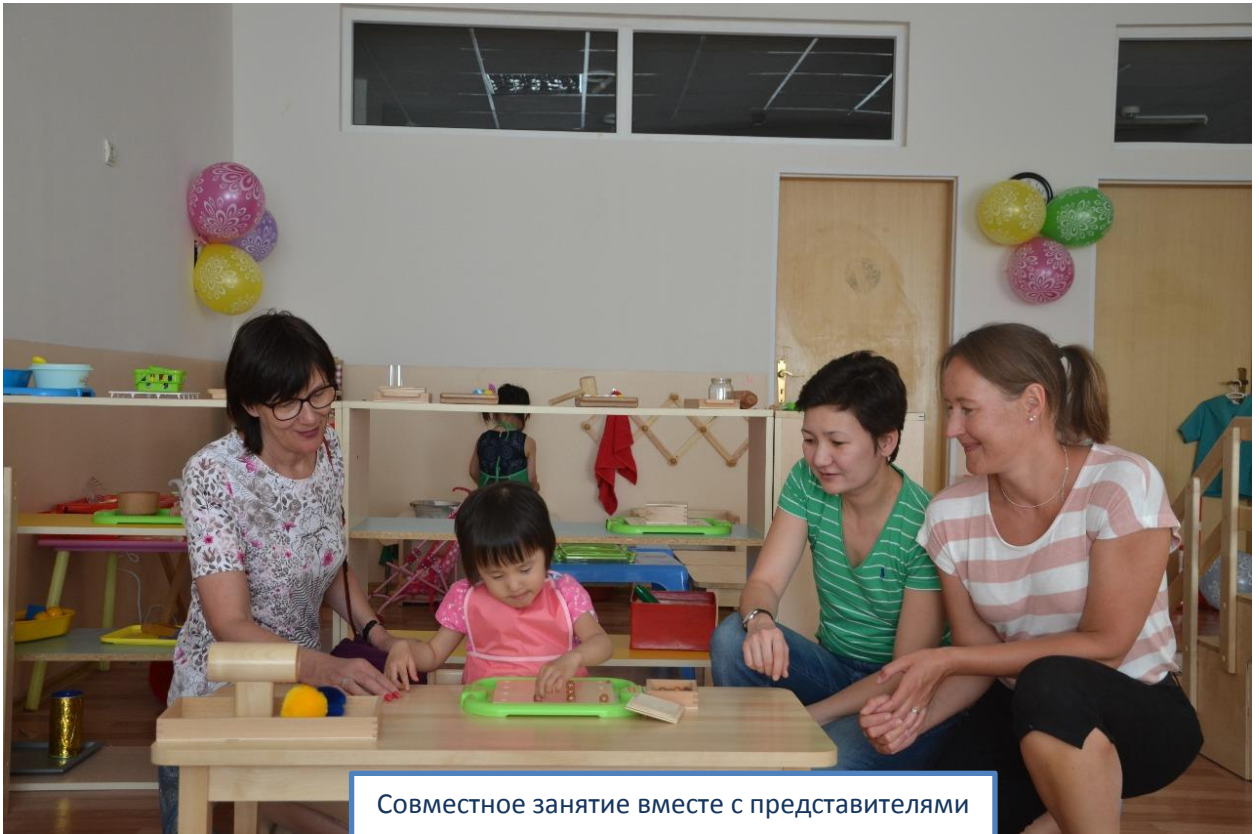
Совместное занятие вместе с представителями Благотворительного комитета