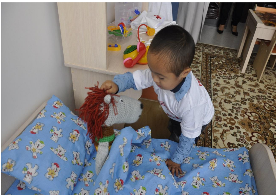
Фото. Занятие в СБО

Роль каждого специалиста важна, так например тифлопедагог помогает детям с нарушениями зрения, обучает шрифту Брайля а также даёт советы по адаптации к полноценной жизни. Ввиду разнообразия и сложности диагнозов, с ребёнком одновременно работают несколько специалистов,